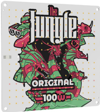
Jungle LED The Jackson 100W Original